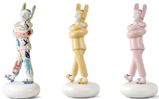
Embraced【限定版】 / Embraced【通常版】 （ソフトイエロー・ソフトピンク）

イタリアを代表するラグジュアリーファニチャーブランド「Poltrona Frau（ポルトローナ・フラウ）」は、スペインのラグジュアリーポーセリンアートブランド「LLADRÓ（リヤドロ）」とコラボレーションし、『Poltrona Frau Tokyo Aoyama meets LLADRÓ』を2022年10月21日（金）から11月3日（木・祝）までポルトローナ・フラウ東京青山にて開催いたします。