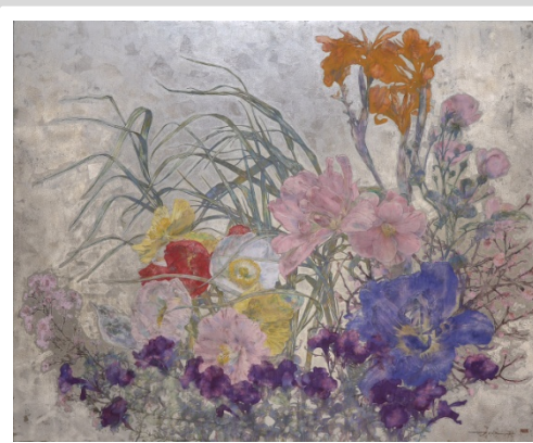
「 derive 」