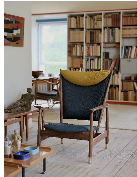
写真の張地 (ファブリック) は ¥1,424,500